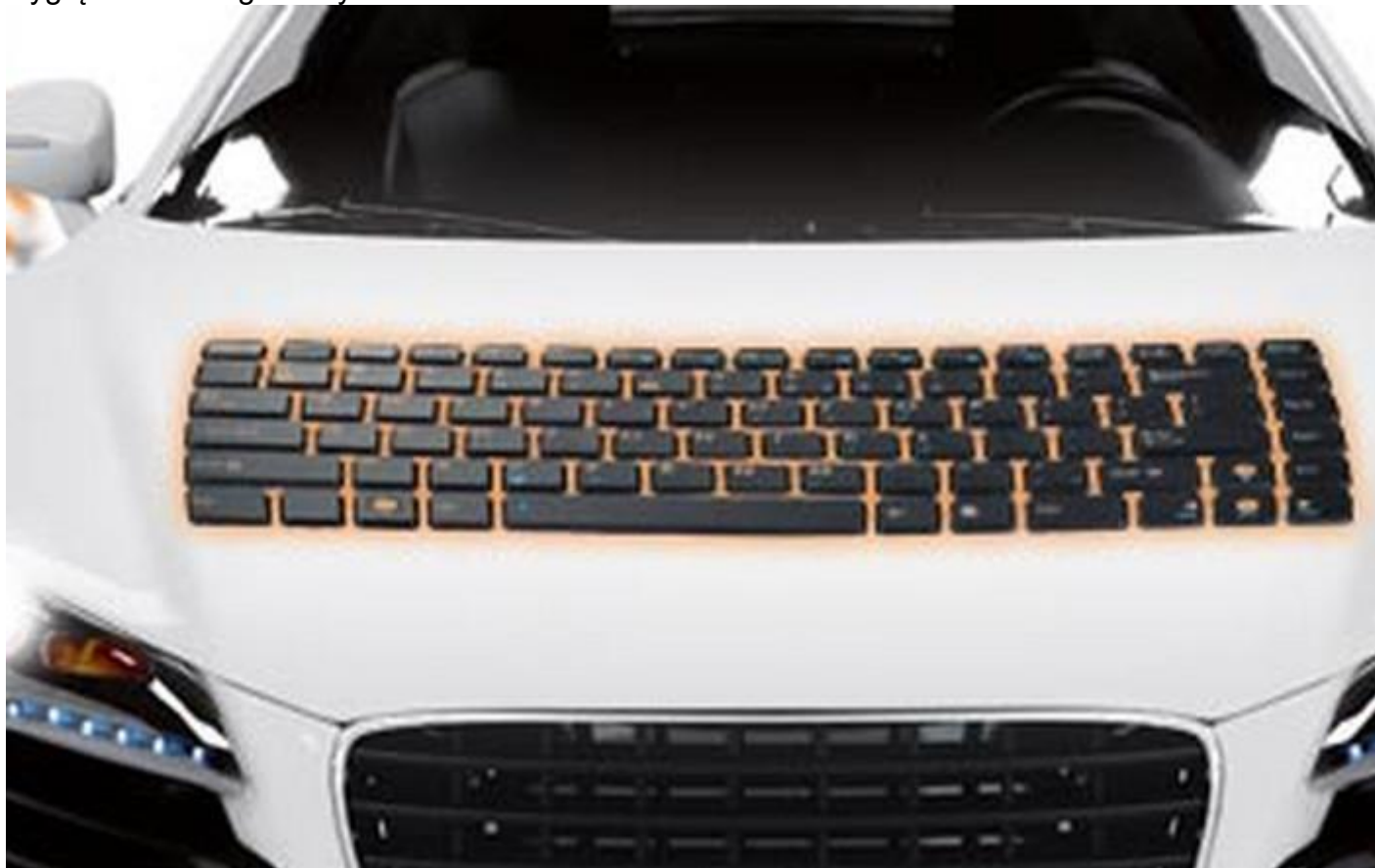
Jak działa komputer w samochodzie

Każdy nowy samochód wyposażony jest w komputer. W żaden sposób nie przypomina on jednak tego, który stoi na naszym biurku. Zobaczmy więc, jak wygląda i do czego służy.